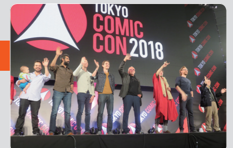
今年も大盛況だった「東京コミコン2018」

「東京コミコン」には、マーベル作品や洋画ドラマファンも多数訪れることもあり、お気に入りのキャラクターに扮したコスプレヤーも多数来場するのも特徴。スカ