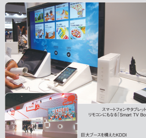
スマートフォンやタブレットがリモコンにもなる「Smart TV Box」

Smart Innovationをスローガンに掲げ、『CEATEC 2012』開催!! KDDI、Smart TV BOXを強力PR