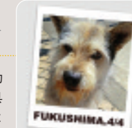
4月4日に救助されたパロン

をより強くした3人は、救助したリキの飼い主が福島県三春町の避難所にいることを知り、3人は4月4日リキを飼い主に渡すミッションと、3人のもとに寄せられた避難区域にいる犬の救助のために、再び福島県へと向かった。「もう会えないかと思っていた」と人目もはばからず泣いて喜ぶ飼い主とリキとの再会を見届け、3人は今回救助依頼があった7件の家を回り、3匹を救助した…。詳細はKUMA KITCHINのblog ( http://yaplog.jp/kumakitchen/ )を。