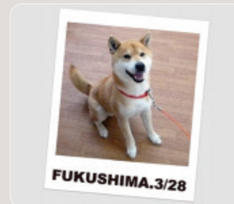
無事再会を果たしたリキ